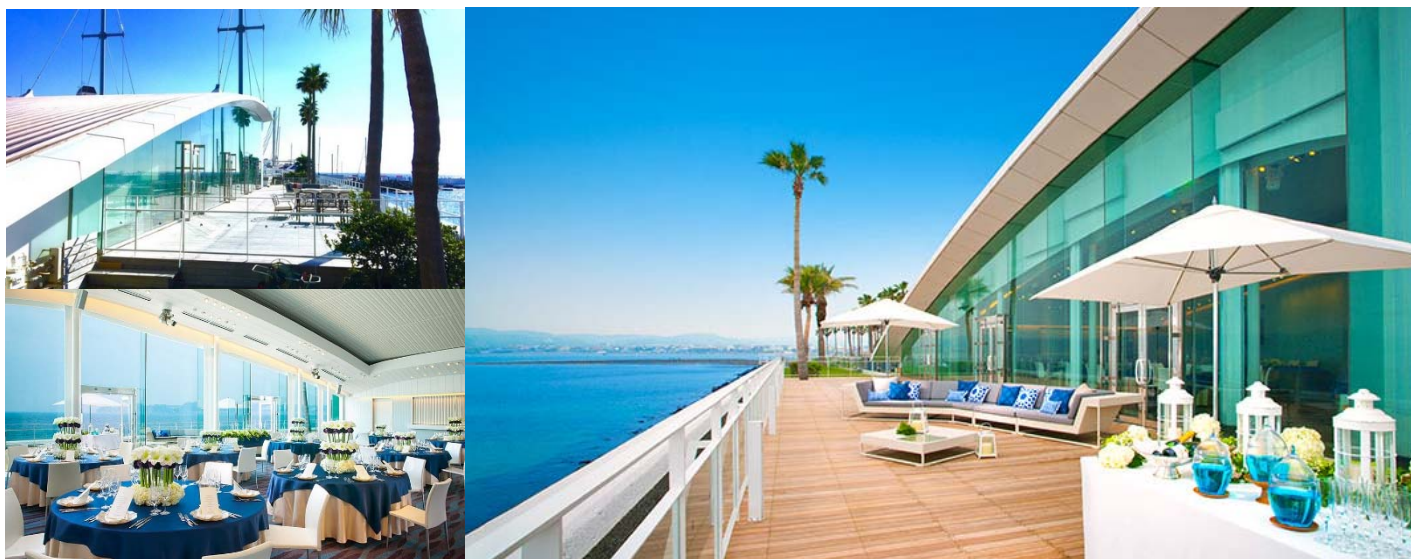
逗子マリーナ ブルービスタ リビエラ

Classic Japan Rally 2018 R134 Spring では、前夜祭をイベント当日のゴールとなる「逗子マリーナ ブルービスタ リビエラ」にて開催いたします。前泊用、後泊用のお部屋もご用意しておりますので、皆様お誘い合わせの上ご参加ください。